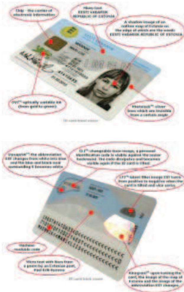
図 1 エストニアのIDカード (13)