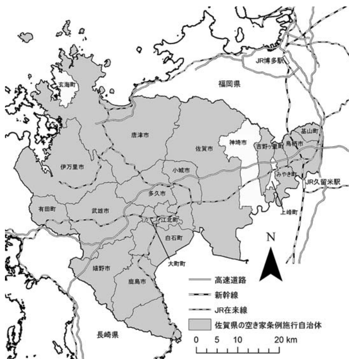
図2 佐賀県における空き家条例施行自治体の分布